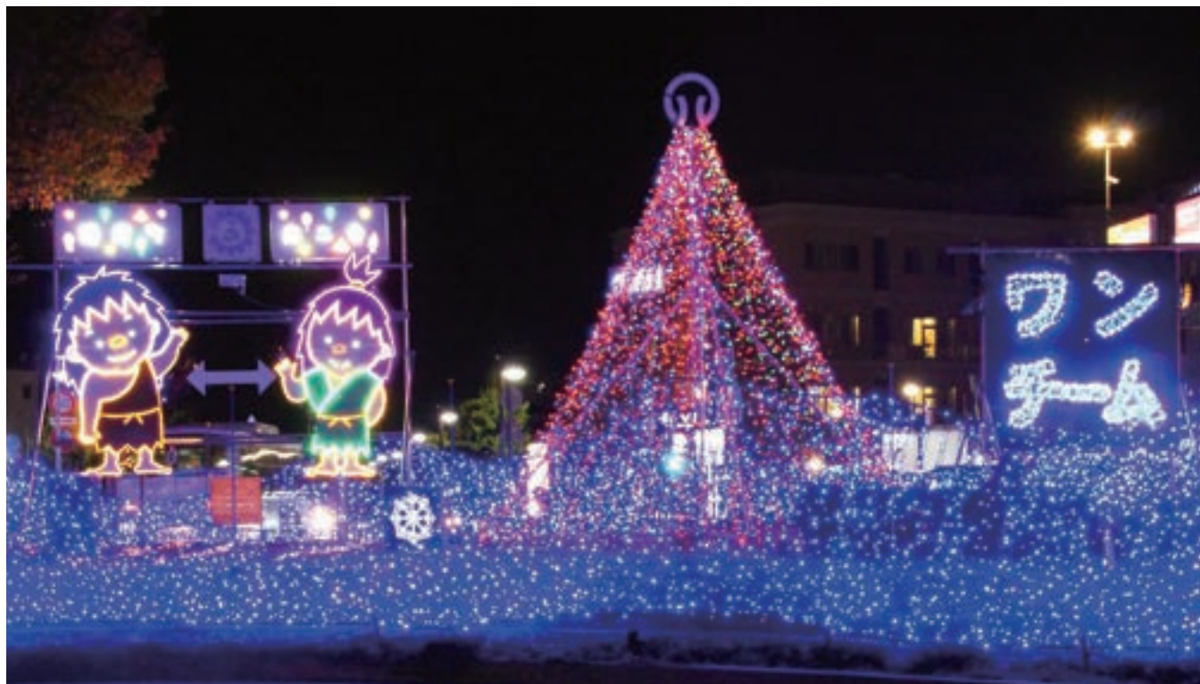
▲播磨町イルミネーション2022

URL http://www.harima-sci.or.jp e-mail: harima@harima-sci.or.jp