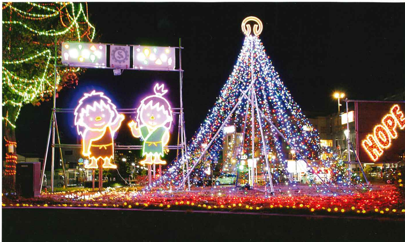
▲播磨町イルミネーション2020

URL http://www.harima-sci.or.jp e-mail: harima@harima-sci.or.jp